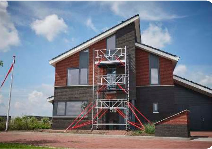
Figuur 1 | mobiele rolsteiger

Onder een rolsteiger verstaan we een mobiele steiger uitgerust met (zwenk)wielen en samengesteld uit geprefabriceerde onderdelen. Rolsteigers bevatten tussenvloeren en één of meerdere werkvloeren voor het uitvoeren van werkzaamheden op hoogte. Ze kunnen vrijstaand of tegen een gevel geplaatst zijn.