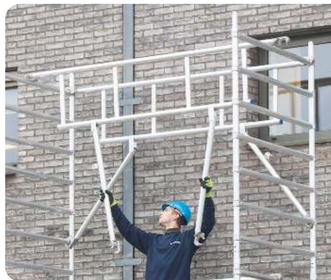
Figuur 3 | montagemethode