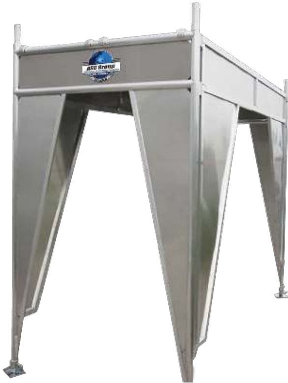
Figuur 7 | Inklimbeveiliging

Wij adviseren/bevelen aan in afwachting van de specifieke NEN 1004-3 voor rolsteigers onder de 2 meter platformhoogte (kamersteigers) de NEN 1004-1 te volgen.