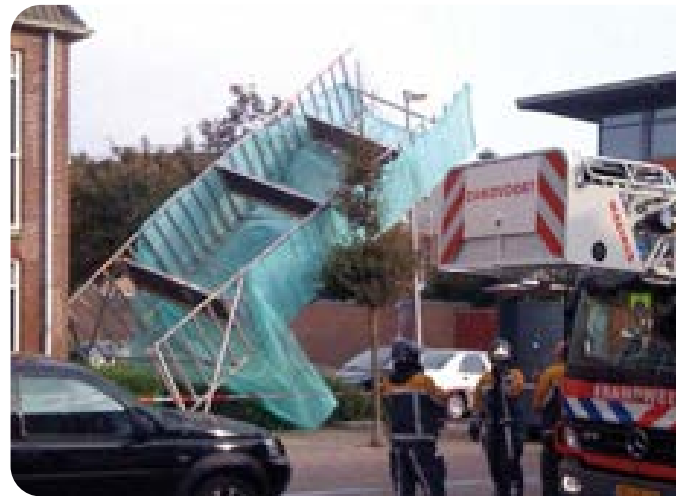
Figuur 2 | omgevallen rolsteiger

Een ongeval kan ook plaatsvinden zonder dat er iemand op de rolsteiger aan het werk is. Bijvoorbeeld door omvallende rolsteigers of doordat er voorwerpen tegenaan stoten of van de rolsteiger afvallen (denk aan gereedschap, rolsteigeronderdelen of bouwmaterialen).