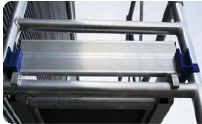
Figuur 6 | leuning en kantplanken